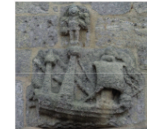
CARAVELLE EN GRANIT

À la fin du Moyen Âge, le territoire fournit des marins réputés, «rouliers des mers occidentales», mais Roscoff n'ayant aucune autonomie, ils se déclarent de Saint-Pol aux agents fiscaux et aux notaires des ports fréquentés.