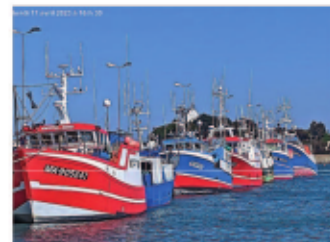
BATEAUX DE PÊCHE AU VIEUX PORT.

Sous l'impulsion des agriculteurs et de la Chambre de commerce et d'industrie de Morlaix, un port de ferry accessible à toute heure est créé sur le site de Blosson (1970-1972), suivi d'un port de pêche avec une criée, puis un port de plaisance de 625 places (2014). La région Bretagne propriétaire des ports a délégué l'exploitation et la gestion du site de Blosson à la CCI métropolitaine Bretagne ouest et celle du vieux port à la commune de Roscoff.