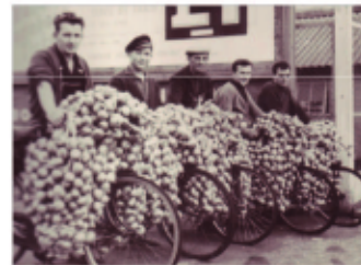
JOHNNIES EN ANGLETERRE